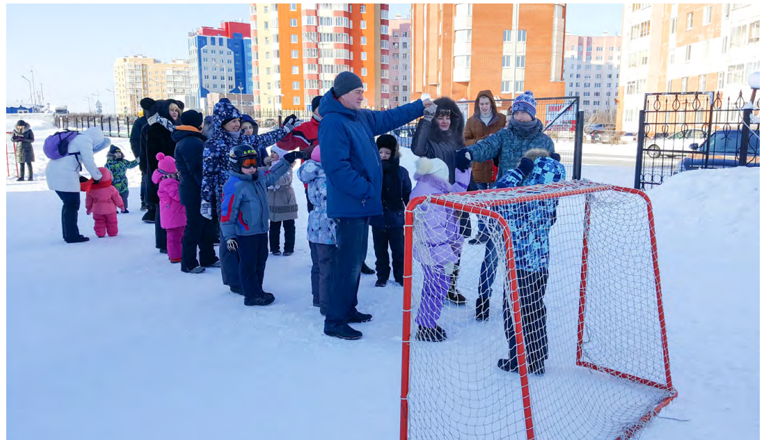
Игра «Семейный ручеек».