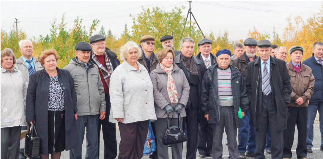
Ветераны Завода по подготовке конденсата к транспорту.

ленному персоналу приходилось заниматься одновременно и строительством, и технологией переработки конденсата.