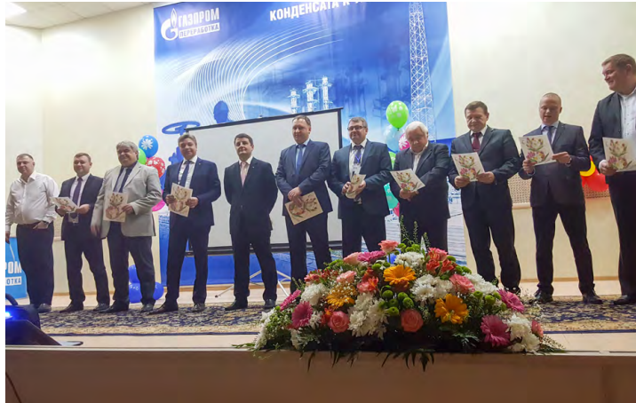
Красивые слова прекрасным дамам.

Накануне Международного женского дня 8 Марта утро для заводчанок началось с букетов цветов и праздничных сувениров. ППО ЗПКТ организовала для женской половины коллектива завода музыкальное поздравление и праздничный концерт в исполнении мужчин – руководителей подразделений и специалистов отделов.