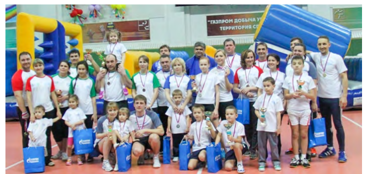
Активные семьи ЗПКТ.

цией по вопросам участия заводчане могут обращаться в группу социального развития (каб. № 105) или ОКИТО (каб. № 106)