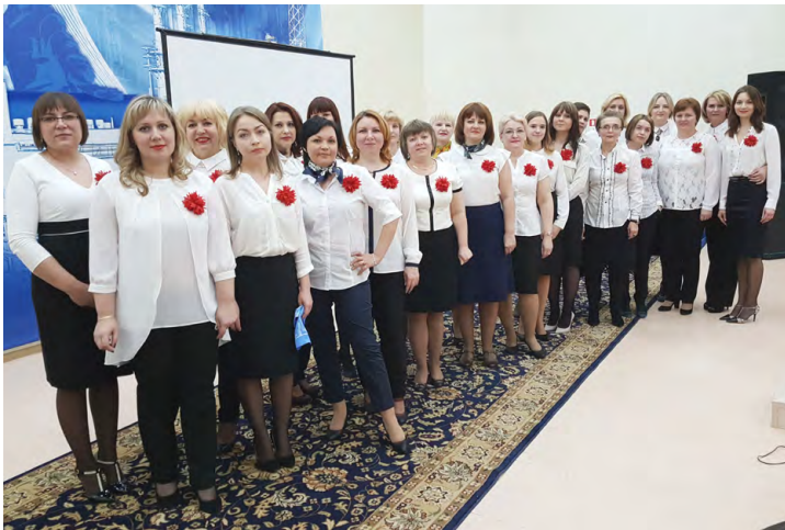
Креативный женский коллектив ЗПКТ.

Душевная творческая импровизация стала своего рода ответным жестом мужчин на премьеру фильма - ремикса, который креативный женский коллектив подготовил коллегам ко Дню защитника отечества.