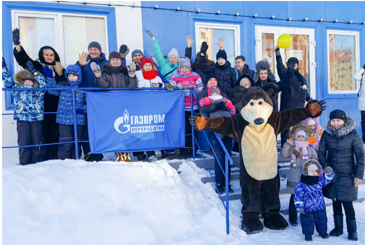
Дружный коллектив ЗПКТ.

Весело, дружно, активно и позитивно отметили работники завода окончание масленичной недели. На территории лыжной базы «Контакт» Советом молодых ученых, работников и специалистов были организованы традиционные «Зимние забавы» - праздник, проводимый в рамках молодежных программ при поддержке первичной профсоюзной организации и группы социального развития завода.