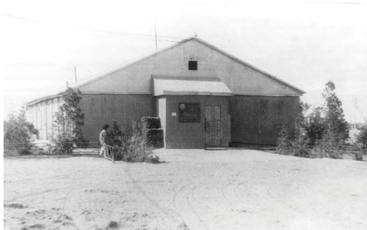
Первое здание заводоуправления.

-Десятки-другой рабочего персонала, инженеры, руководители, три вагончика, свайное