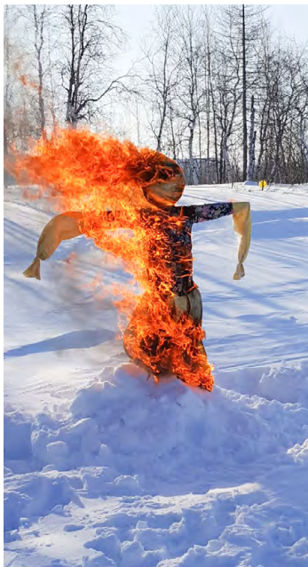
Гори, гори ясно, чтобы не погасло!