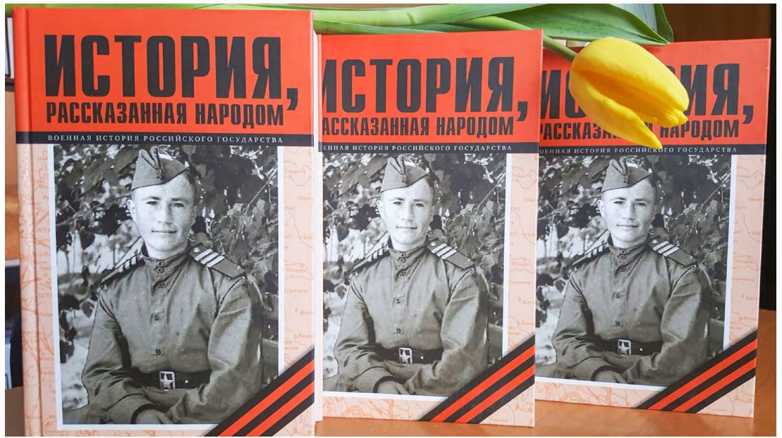
История в воспоминаниях заводчан.

Российская академия наук и Институт экономических стратегий уже не первый год реализуют проект «Военная история российского государства». ООО «Газпром переработка» ПАО «Газпром» приняло в нем активное участие. ССО и СМИ