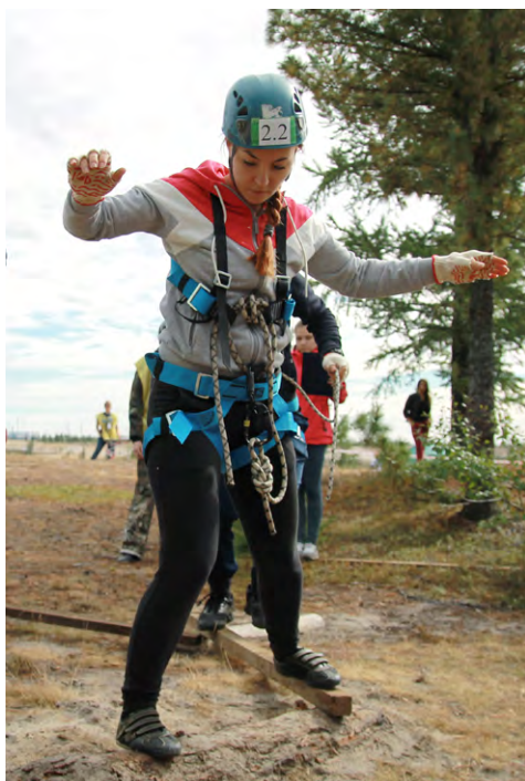
А ну-ка, девушки!

К большой радости коллег и нашему небольшому сожалению, второй год подряд команда ООО «Газпром добыча Ямбург» стала победителем Турфеста, приз за второе место взяла команда ООО «Газпром добыча Уренгой», а третью строчку протокола