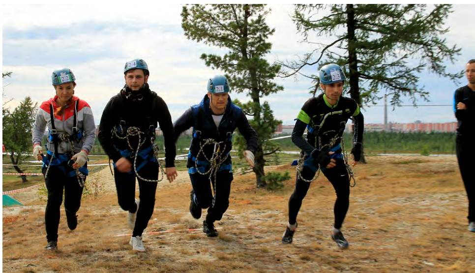
Финиш! Важна каждая доля секунды!