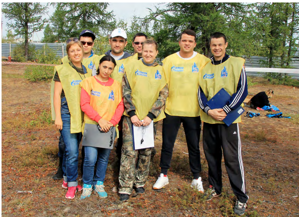
Судейская бригада Турфеста