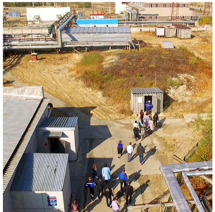
Эвакуация работников АУПа на период локализации ситуации по захвату террористов