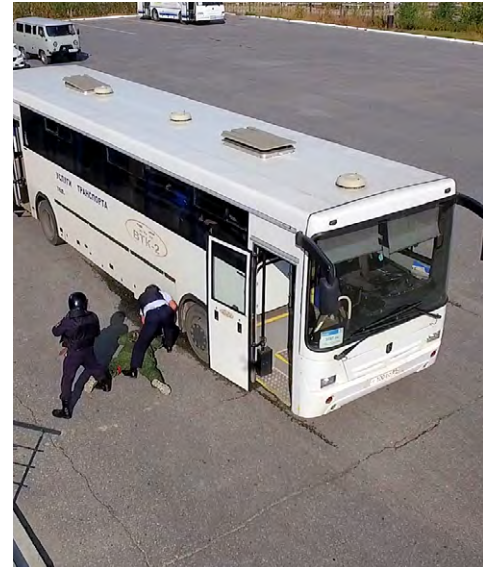
Захват предполагаемого террориста

11 августа, в соответствии с приказом № 422-ОД от 22.07.2016 г. «О подготовке и проведении командно-штабных учений», на ЗПКТ состоялись командно-штабные учения по противодействию террористическим угрозам.