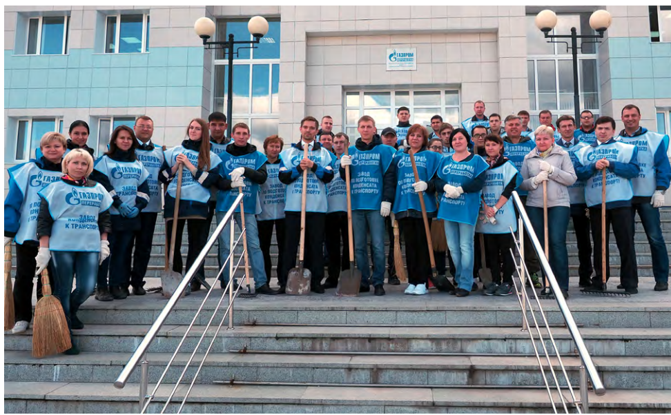
Поработали славно! Настроение - праздничное!

Предпраздничный день 2 сентября на заводе по подготовке конденсата к транспорту ООО «Газпром переработка» (ЗПКТ) выдался хлопотным. С утра в актовом зале АБК чествовали лучших работников завода и вручали им заслуженные награды. А после обеда, так же дружно и с прекрасным настроением, в рамках Всероссийской экологической акции «Зеленая Россия», «Чистый лес», «Живи, лес», заводчане вышли на субботник.