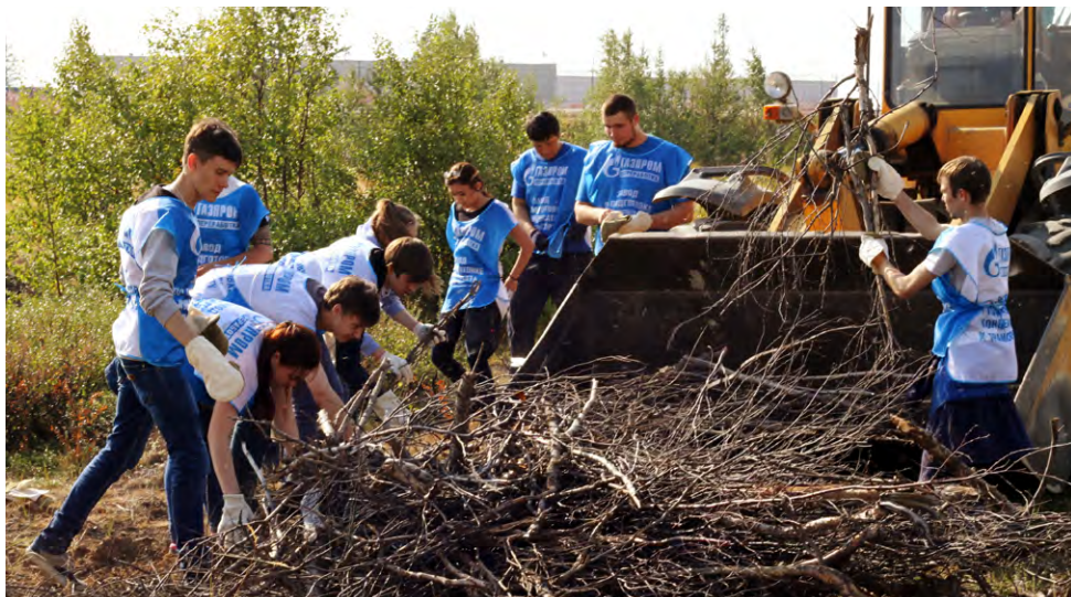
Чисто там, где вовремя убирают!

Нынешнее лето в Новом Уренгое выдалось особенно жарким и сухим. Своевременная уборка высохшей травы и кустарников