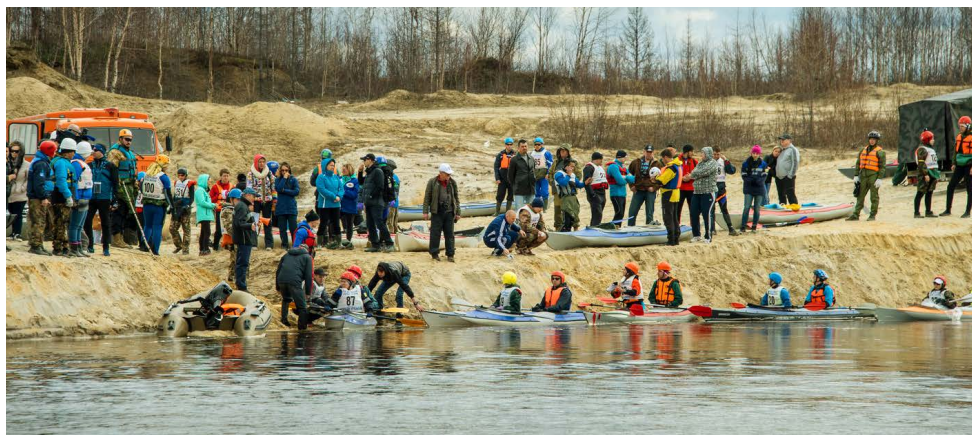
Скоро будет дан первый старт

В течение двух дней – 4 и 5 июня – в Новом Уренгое проходил открытый чемпионат «дистанция водная байдарка» «Яха-марафон-2016». Соревнования проходили 13-й раз. В них приняли участие 21 мужская команда и 12 смешанных, всего 66 спортсменов. ЗПКТ на этот раз выставил три экипажа, один из них – смешанный.