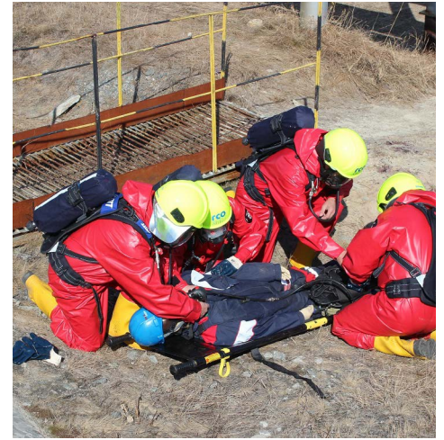
Оказание первой помощи пострадавшему (ГСО)

В рамках мероприятий по надзору Главного управления МЧС России по ЯНАО на заводе по подготовке конденсата к транспорту прошли командно-штабные учения (КШУ) по теме «Локализация и ликвидация последствий разлива нефтепродуктов на ЗПКТ ООО «Газпром переработка»»