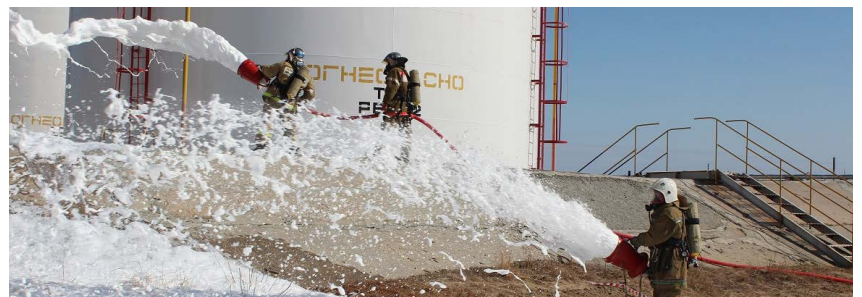
Покрывание пеной очага аварии (ПЧ-19)