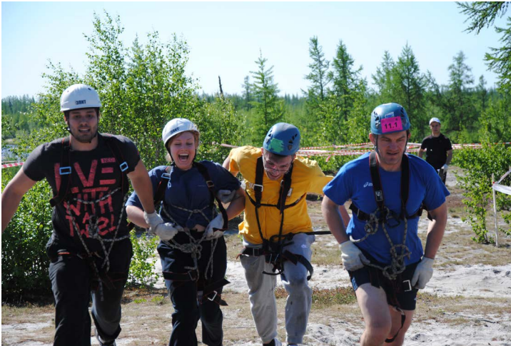
Дружнее! Ведь мы - команда!