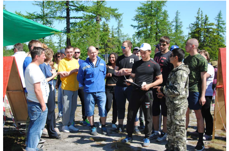
Предстартовый инструктаж этапа «Туристическая полоса»