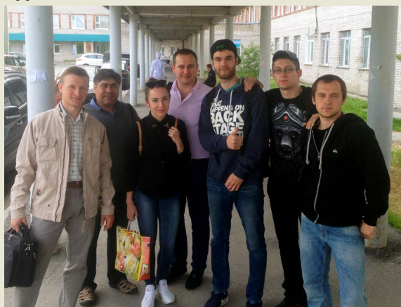
Участники акции по сдаче крови у городской поликлиники

ежегодным мероприятиям для коллектива завода, ведь мы считаем, что сдача крови – благородная миссия. У нас на ЗПКТ работает много доноров, почетных в том числе. Такие люди, которые не жалеют собственной крови, чтобы спасти жизнь другому, совсем незнакомого человека, вызывают большое уважение. Мы будем следовать этому гуманному принципу и в будущих акциях.