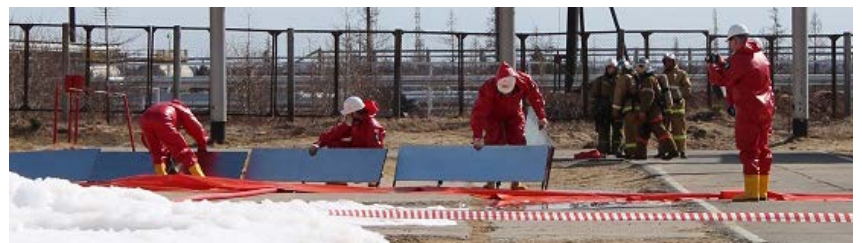
Локализация места разлива нефтепродуктов методом установки подпорных стенок