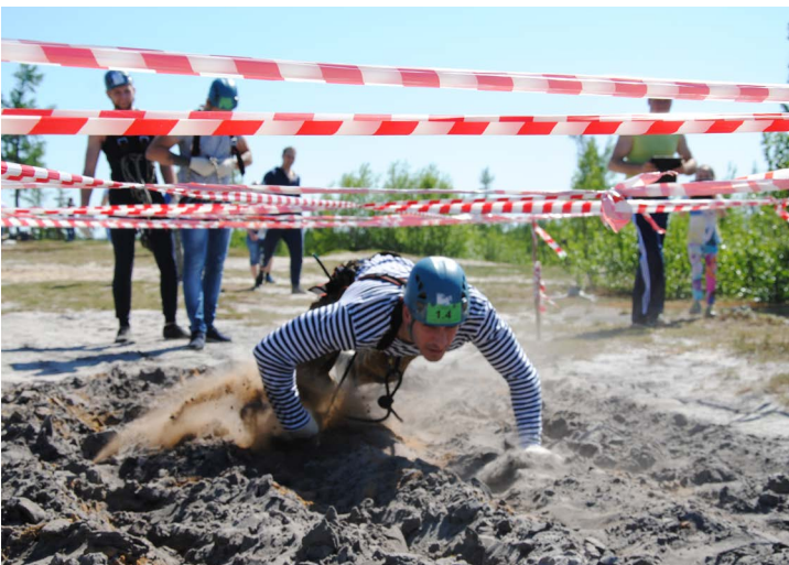
Победа даётся нелегко!

– Надо отдать должное новому составу актива молодежи завода: они справились с огромной задачей! Всё было организовано лучшим образом: подготовка площадки, транспорт для заводчан, этапы конкурса и сопутствующая экипировка, питание, призы и многое другое. Примечательно, что наряду с нашей молодежью во всех конкурсах активно и небезрезультатно принимали участие работники постарше. Это здорово! Вот что значит общая идея и позитивный настрой!