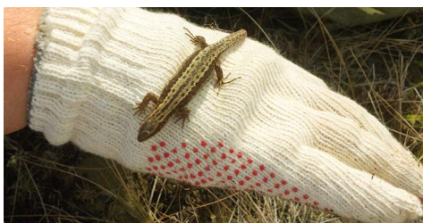
Обитателям тундры - чистую экологию!