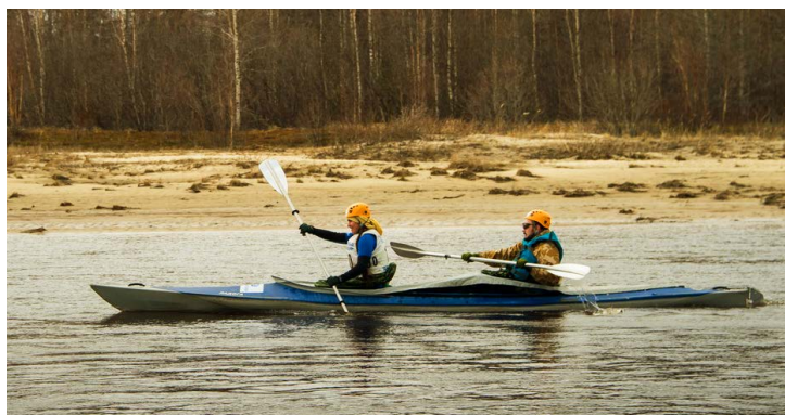
В первый день соревнований байдарочникам пришлось пройти более 40 км