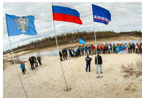
Торжественное открытие чемпионата «Яха-марафон - 2016»