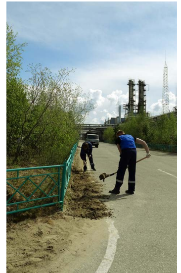
На территории технологических объектов будет порядок!

Следующая уборка в рамках экологического субботника пройдет на ЗПКТ в третьем квартале текущего года.