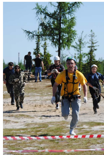
Опередить соперника и оторваться от преследователей нелегко, но надо!