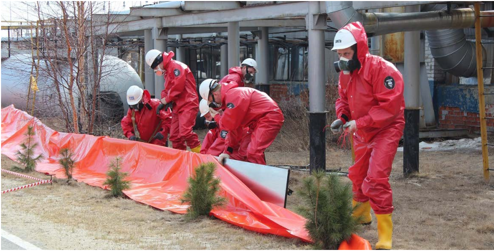
Выполнение задачи по локализации разлива силами нештатного аварийно-спасательного формирования