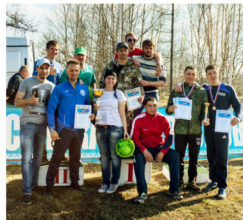
Сборная ЗПКТ ООО «Газпром переработка»