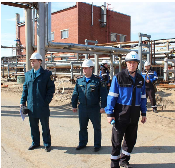
Работа комиссии отдела надзорной деятельности и профилактической работы ГУ МЧС России по ЯНАО