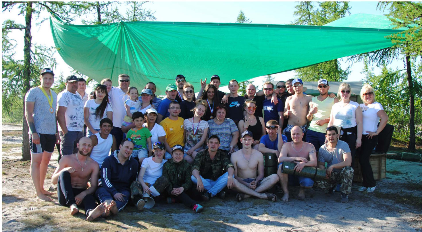
Да здравствует молодость духа! Заводчане провели прекрасные выходные на природе с огромной пользой!

В Новом Уренгое наступило лето. А на ЗПКТ уже сложилась традиция открывать мероприятия на природе праздником – Днем молодежи. В этом году он прошел 18 июня на площадке городского турслета в районе реки Ево-Яха. День молодежи проводился Советом молодых ученых, рабочих и специалистов при поддержке первичной профсоюзной организации и группы социального развития.