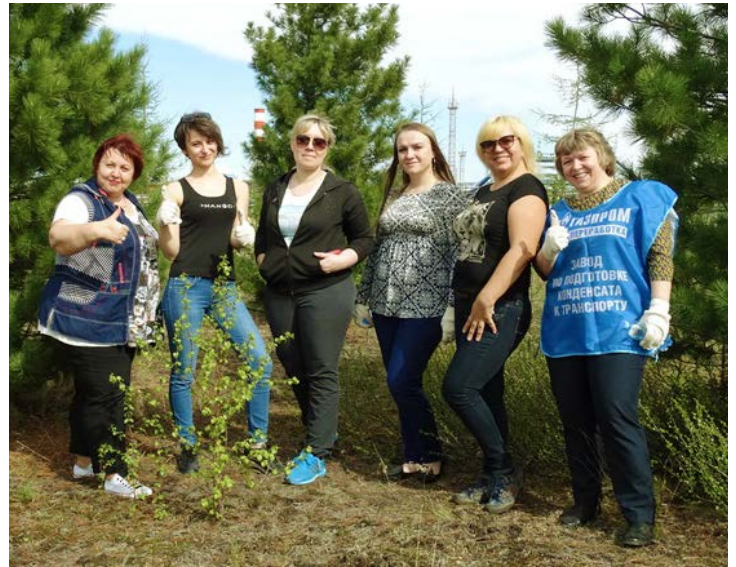
Субботник окончен. Можно запечатлеться на фоне заводских кедров

11 июня на ЗПКТ в рамках Всероссийской экологической акции «Зеленая весна», организованного Неправительственным экологическим фондом имени В.И. Вернадского, был проведен субботник. Целью данного мероприятия стало улучшение экологического состояния окружающей среды, санитарная очистка и благоустройство закрепленных территорий за подразделениями завода.