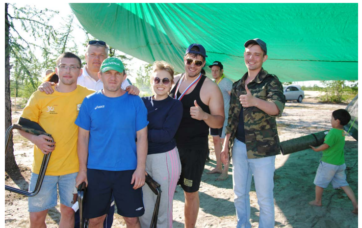
Команда «Молодость» оправдала все ожидания. 1 место!