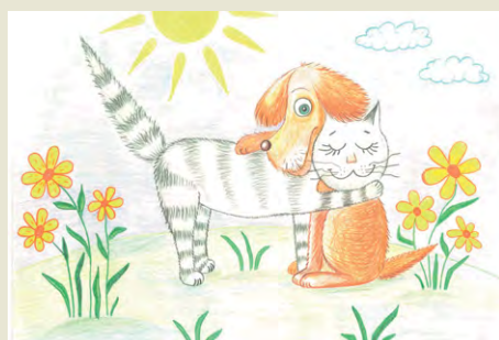
Автор - Виталина Вороненко