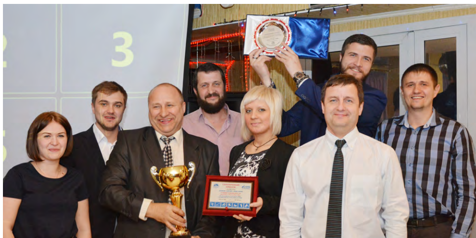
Группа лучших спортсменов ЗПКТ