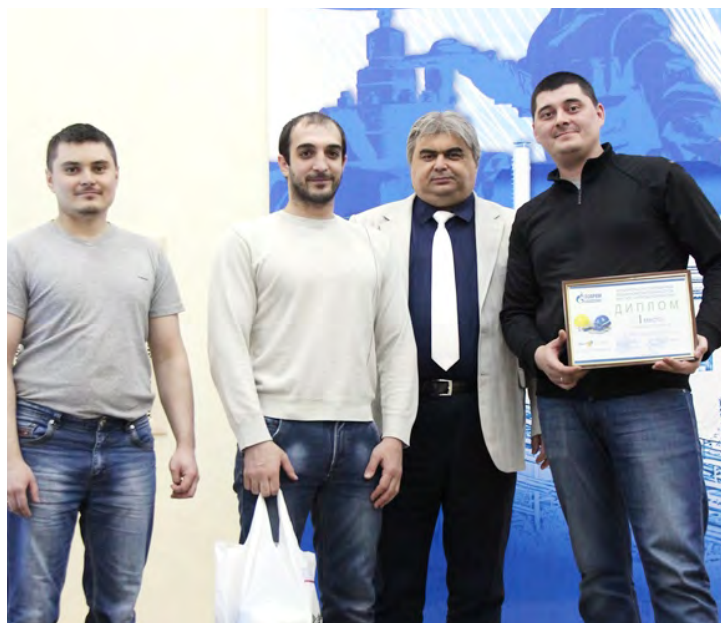
Команда «Содружество». 1 место