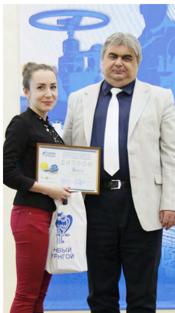
Команда Центральной заводской лаборатории заняла 2 место