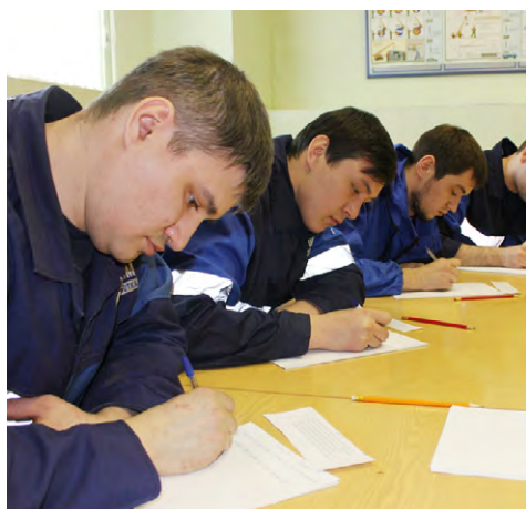
Тишина! Идет экзамен