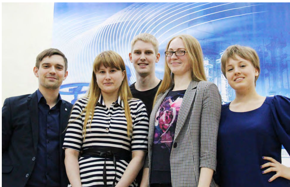
Организаторы турнира «Мультиигры» - члены молодежного актива

На ЗПКТ состоялся турнир по игре «Мультиигры», который стал уже традиционным весенним интеллектуальным мероприятием. Турнир был организован Советом молодых ученых и специалистов при поддержке первичной профсоюзной организации и был посвящен в этом году всемирному Дню охраны труда и Году охраны труда в ПАО «Газпром».