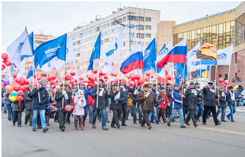
Работники ЗПКТ в праздничном шествии, посвященном Дню Победы