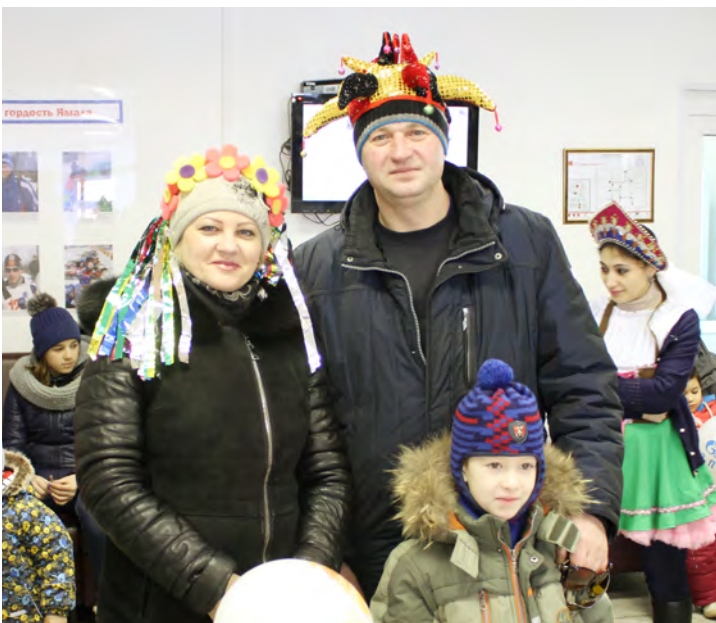
Празднику рады и взрослые, и дети!