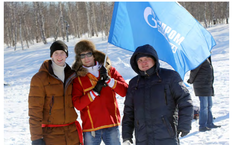
Настроение - отличное!

Завершились «Зимние забавы» общим хороводом и традиционным сжиганием чучела Зимы, после чего начались веселые катания с горки на современных салазках – тюбингах. ■