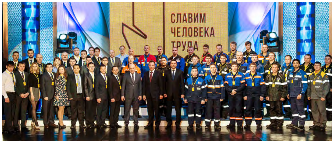
Фото на память в день открытия конкурса. В центре - Полномочный представитель Президента РФ в Уральском федеральном округе Игорь Холманских

С 22 по 23 марта в Новом Уренгое проходил окружной (заключительный) этап конкурса профессионального мастерства «Славим человека труда!» Уральского федерального округа в номинациях «Лучший оператор по добыче нефти и газа» и «Лучший инженер по системам автоматизированного проектирования». В конкурсах приняли участие 31 рабочий, 15 инженеров и 9 студентов из ЯНАО, ХМАО-Югра, Тюменской и Челябинской областей. Площадкой для проведения конкурса во второй раз стало ООО «Газпром добыча Уренгой».