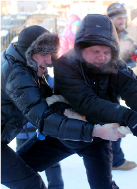
Еще немного, еще чуть-чуть!