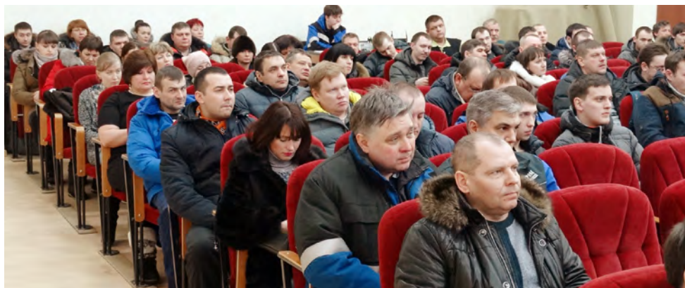
В марте на ЗПКТ состоялись ежеквартальные собрания сменного персонала и специалистов