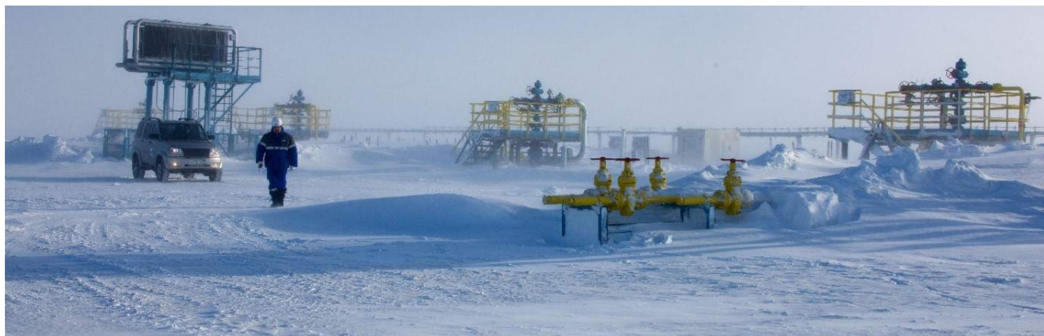
Фото: весна на Бованенково, сайт ПАО «Газпром».

альных партнера – администрация и «Газпром профсоюз» – показывают, что умеют совместно решать общие задачи и экономического, и социального содержания. Повышение производительности труда, обеспечение плановых экономических показателей, бесперебойное, безопасное и безаварийное производство, социальная стабильность в организациях и в целом в территориях присутствия – это наши общие задачи, которые успешно решаются. Безусловно, принятое в конце 2017 года решение показало важность слаженных действий профсоюзных организаций, входящих в систему «Газпром профсоюза». Активная позиция на местах, кропотливая работа аппарата «Газпром профсоюза» вместе дали этот результат, дающий право уверенно смотреть в будущее «Газпрома», «Газпром профсоюза» и всех, кто здесь работает.