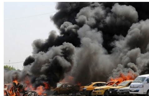
Взрыв на автозаправке близ Багдада, Иран, 2016 год.