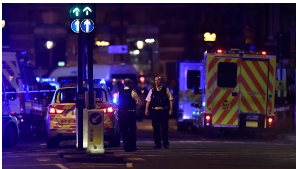
В ночь на 4 июня в Лондоне произошла серия нападений, два из которых официально признаны терактами. На Лондонском мосту микроавтобус въехал в толпу, а на рынке «Боро - маркет» вооруженный ножом преступник напал на людей.

Продолжение в следующем номере «Вестника».