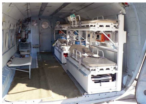
На фото: в пассажирской кабине вертолета-госпиталя Ми-8МТВ-1

подход. На Казанском авиазаводе на базе вертолета Ми-8 был создан не просто санитарный вертолет, был изготовлен самый настоящий летающий госпиталь! Необходимое реанимационное и кислородное оборудование, стол для проведения операций и кресло для принятия родов. Были даже установлены дополнительные бензобаки – и вертолет мог совершать перелет на 800 километров без дозаправки. То есть до любой удаленной точки Ямала. Наконец, были созданы условия и для самих врачей – подготовиться к операции, отдохнуть от сверхнапряженного графика.