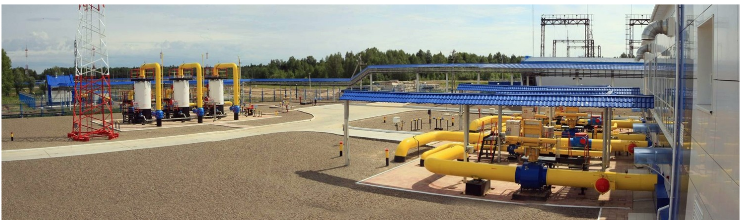
На фото: один из объектов ООО «Газпром трансгаз Томск».