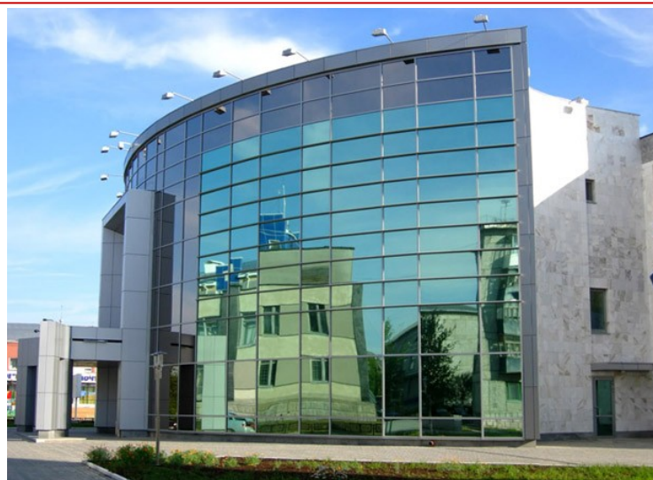
Культурно-спортивный комплекс «Норд» Общества «Газпром трансгаз Югорск».

- На самом деле КСК занимается решением тех проблем, которые являются одной из сторон деятельности профсоюзной органи-