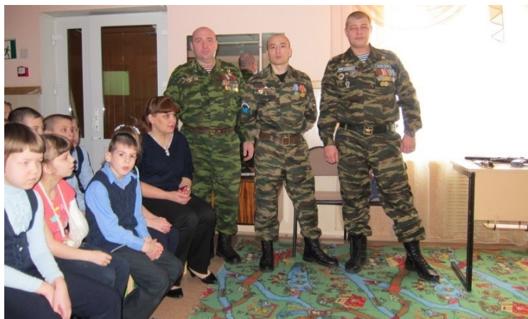
«Урок Мужества», Моряковская школа - интернат «Радуга».

определения лучшего уполномоченного по охране труда, предложенной и внедренной в марте 2016 года. В этой методике кроме постоянных применяемых критериев – теоретической части (тесты на компьютере о знании основ законодательства в области охраны труда) и практической части (оказание доврачебной помощи пострадавшему на тренажере «Гоша»), был введен еще один критерий – практическое выявление нарушений по ОТ на предложенных конкурсанту объектах (специально создаваемые нарушения). Так в Томском ЛПУМГ впервые прошел I этап конкурса «Лучший по профессии» в номинации «Лучший уполномоченный по охране труда». Впоследствии данная методика была применена на конкурсе профессионального мастерства ООО «Газпром трансгаз Томск», который проходил в июне 2016-го. Рассказ был бы не полным, если не показать несколько мероприятий профсоюзной организации Томского ЛПУМГ, в которой принимали участие уполномоченные профсоюза. Это проведенные мероприятия в подшефном детском доме «Радуга» – «Урок мужества», где один из уполномо-