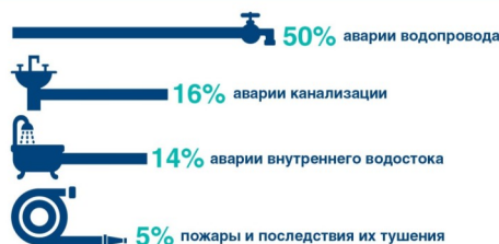
Наиболее частые причины повреждения имущества в квартирах

которые не страхуются работодателем. Программа включает в себя добровольное страхование жилья и домашнего имущества, автострахование, страхование от несчастного случая, страхование путешественников. При этом в программе предусмотрена возможность сэкономить вашей семье до 20% от стоимости страхового полиса и иные льготные условия.