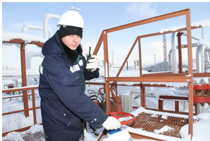
На фото: работник газового промысла Ковыктинского газоконденсатного месторождения ООО «Газпром добыча Иркутск».