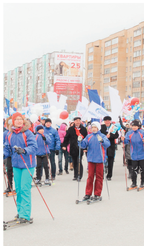
Представители ООО «Газпром трансгаз Сургут»

Сургут и Сургутский район в очередной раз продемонстрировали профсоюзную сплочённость в борьбе за интересы и права северян.