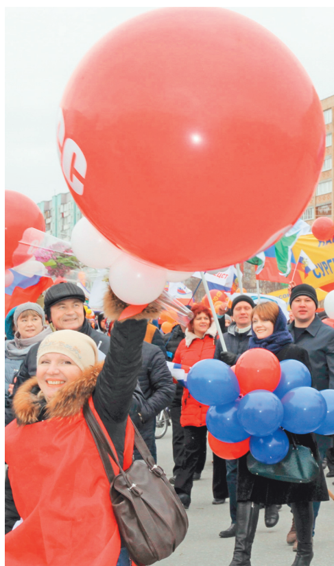
Представители ОАО «Сургутнефтегаз»

Праздничную колонну возглавляли представители Объединения организаций профсоюзов Сургута и Сургутского района – нефтяники и газовики, энергетики, железнодорожники, медицинские работники. «Высокая зарплата народа –