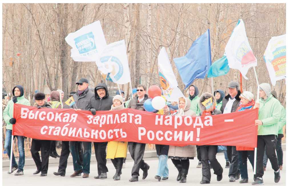
Профсоюзные лидеры во главе шествия

стабильность России!» – гласил главный лозунг профсоюзов.