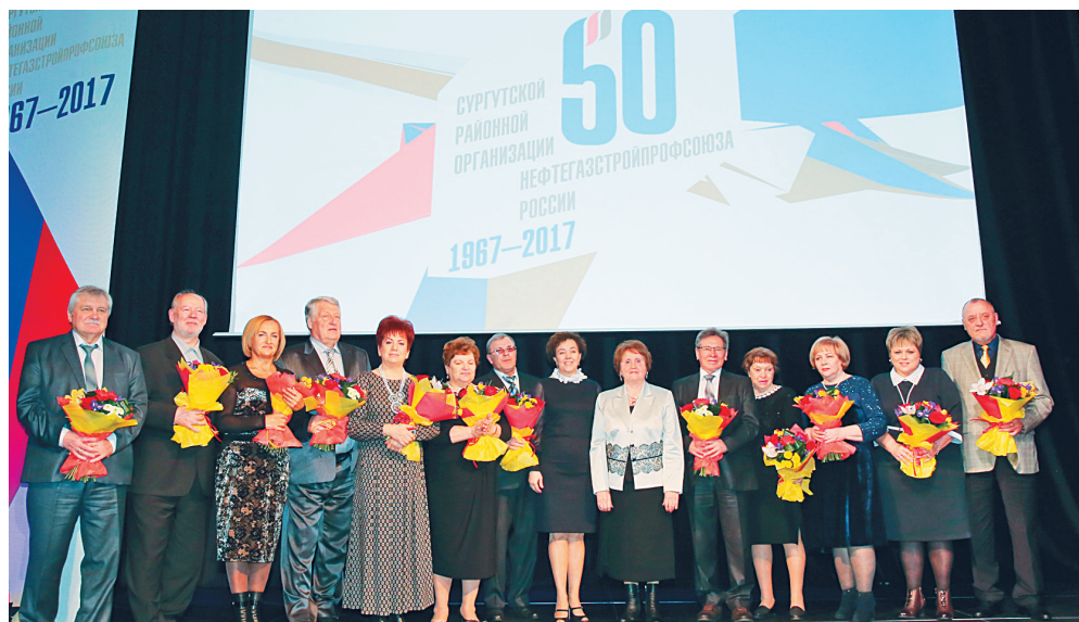
Ветераны Сургутской районной организации профсоюза

Много добрых слов было сказано вы- ступающими в адрес Сургутской районной