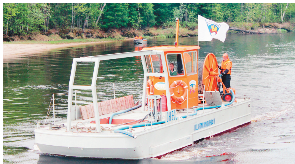
Будни моей профессии