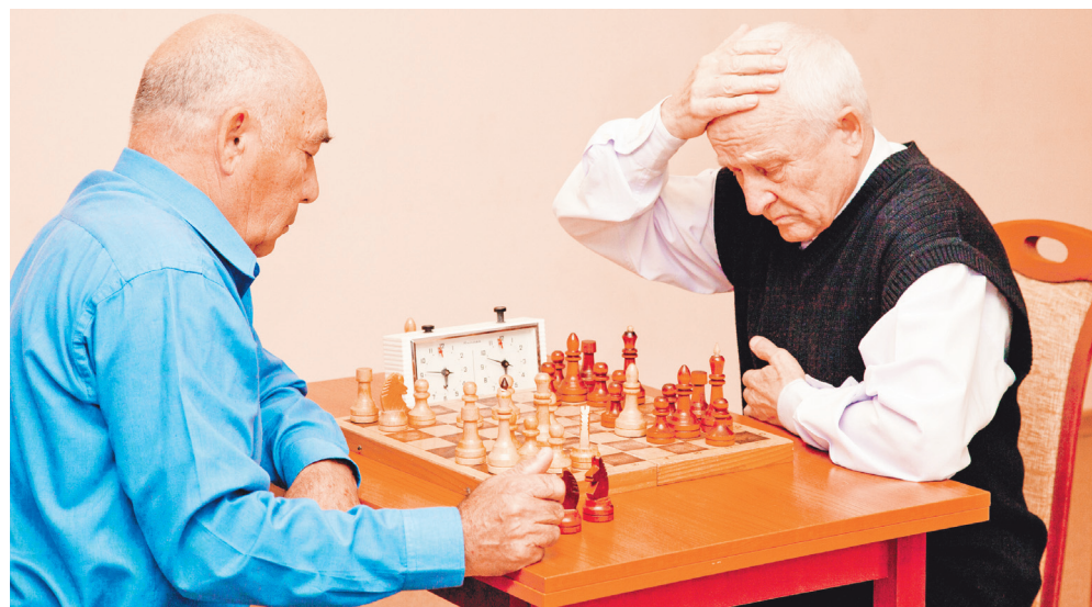
Ветераны в почёте

28 февраля 2017 года в ДИ «Нефтяник» для участников торжественного собрания, посвящённого 50-летию Сургутской районной организации, будет представлена фотовыставка «50 лет Сургутской районной организации Нефтегазстройпрофсоюза России». Она включает три отдельных блока – «Мгновения истории», «В новом тысячелетии» и «Фотоконкурс «Профсоюз в лицах».