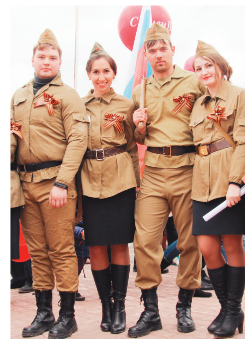
Мы – молодые