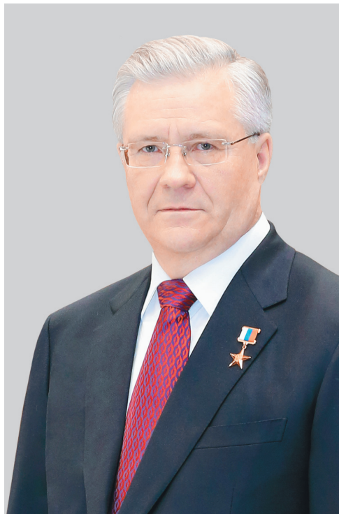
В.Л. БОГДАНОВ, генеральный директор ОАО «Сургутнефтегаз»