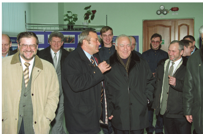
В центре – Юрий Важенин и Виктор Черномырдин во время посещения в ЛКС 35-64 на Сургутском ЗСК. 2002 год