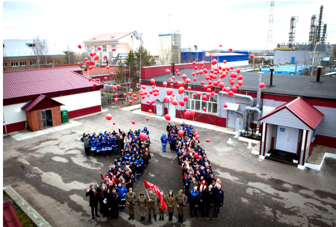
Флешмоб ко дню Победы на Сургутском ЗСК

с тушёной и горячим чаем. Чувствовалось какое-то особое единение и волнение, ведь День Победы – особая дата в истории страны, которая никого не оставляет равнодушным.