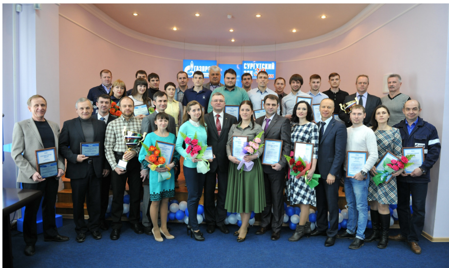
Спортивная элита Сургутского ЗСК 2015

серебряным призёром Чемпионата России по кикбоксингу в г. Новосибирске.