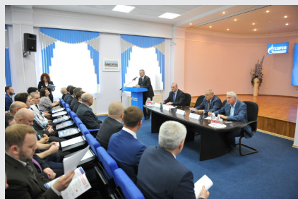
Встреча участников предварительного голосования с коллективом Сургутского ЗСК

26 мая в отделении партии «Единая Россия» г. Сургута состоялось заседание местного организационного комитета по проведению предварительного голосования. В число лидеров для последующего выдвижения в депутаты Думы города Сургута шестого созыва вошли газовики: