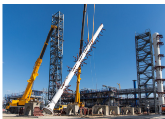
Подъём колонны К2

23-24 мая на площадке строящейся Установки очистки пропановой фракции от метанола с блоком осушки товарной продукции специалисты генподрядной организации ОАО «Салаватнефтехимремстрой» произвели подъём колонн ректификации. Две стальные колонны, высотой 32 и 42, 5 м общей массой порядка 80 тн были доставлены с завода – изготовителя из Дзержинска Нижегородской области автомобильным транспортом.