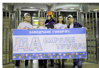
Итоговый плакат акции с подписями

На центральной заводской проходной и в холле административного здания заводчан встречали представители молодёжного актива. Волонтеры информировали персонал предприятия о теме дня охраны тру-