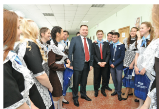
Перед началом церемонии последнего звонка

Основным критерием отбора стала успеваемость со средним баллом не ниже 4, в том числе по профильным предме-