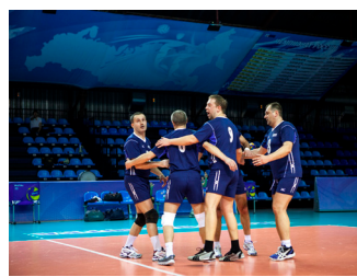
После забитого мяча. Сборная АСУИМ

ли с интригой и азартом. Команды-призеры имели равные шансы на победу, так как в составе каждой из них играли заводские спортсмены