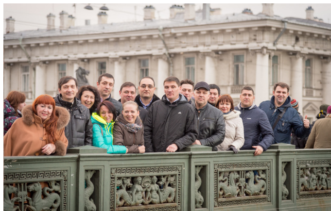
По дороге к месту обучения в Санкт-Петербурге