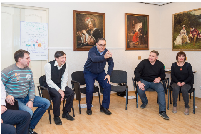
Выполнение практического задания