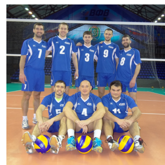
Сборная команда по волейболу ООО «Газпром переработка»

В феврале стартовал первый этап Чемпионата ХМАО – Югры по волейболу среди мужских команд. 5-6 марта прошли встречи между «Аверсом» (г. Сургут) и сборной Сургутского ЗСК ООО «Газпром переработка». Команды хорошо знают друг друга, так как не раз встречались на городских и окружных соревнованиях. Год назад, в окружном Чемпионате-2015, «Аверс» одержал победу над заводчанами. В этом году команда Сургутского ЗСК, взяв реванш, одержала победу со счетом 3:1 и 3:2.