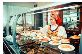
На раздаче блюд

Одна из февральских трудовых недель на Сургутском ЗСК завершилась днём русской кухни в рабочей столовой. Его подготовили работники ООО «Таможенно-Транспортный Терминал», которое оказывает услуги по организации общественного питания. Блюда праздничного меню были представлены на раздаче и на дегустационном столе.