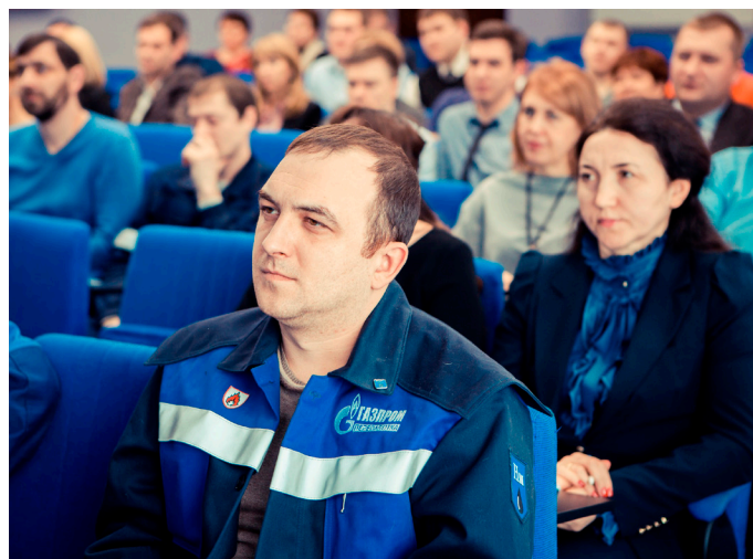
Делегаты конференции трудового коллектива Сургутского ЗСК

ников конференции вызвала информация по выполнению раздела Коллективного договора «Социальные льготы, гарантии и компенсации». Так, по статье «Пособие работникам, впервые уволившимся на трудовую пенсию по старости», в 2014г. было потрачено 34 миллиона 972 тысячи рублей, а в 2015 году – 77 миллионов 476 тысяч рублей. По этим суммам видно, что Обществом заботится как о работниках пенсионного возраста, так и о ротации кадров.