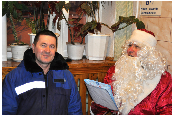
Новогоднего волшебника ждут с нетерпением

старшая в другом городе живёт. Она недавно звонила и рассказывала, что помнит, как я её в детстве поздравлял. А младшая дочка пожаловалась как-то, говорит: «Папа, я же знаю, что ты Дедом