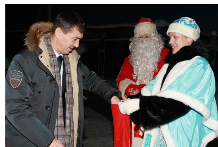
На проходной цеха отгрузки готовой продукции

помогла сгладить суматоху и напряжение отчётных декабрьских дней. Заводчане искренне радовались новогодним новинкам и с удовольствием фотографировались возле нарядной ёлки с Дедом Морозом и Снегурочкой.