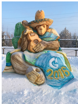
Ледовая фигура производства №3, автор Денис Панасюк

1 место – производство № 3 (автор Денис Панасюк)