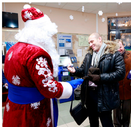
Пямо с порога – новогоднее поздравление

«Несмотря на то, что все мы давно стали взрослыми, в новогодние чудеса всё же ве-