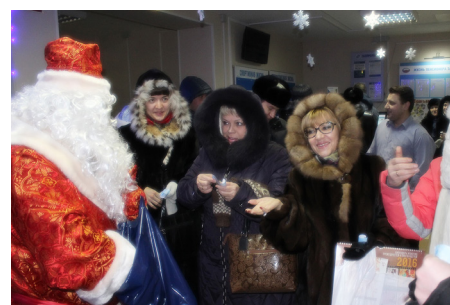
Новогодние предсказания вызвали живой интерес женской части коллектива

В этом году завод был украшен по-особому, причём все работы проводились в вечернее время, чтобы утром порадовать людей, спешащих на службу. Настоящие сосёнки, новогодние персонажи, много огней, снежинок и гирлянд создавали особую атмосферу добра и уюта, которая