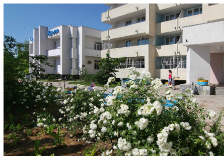
Санаторий Орен-Крым в Евпатории

Расширение перечня санаторно-курортных учреждений обусловлено тем, что в настоящее время компенсация расходов на отдых производится только по здравницам ПАО «Газпром», где наличие мест для сторонних организаций ограничено, так как они заняты работниками дочернего общества – владельца объекта отдыха.