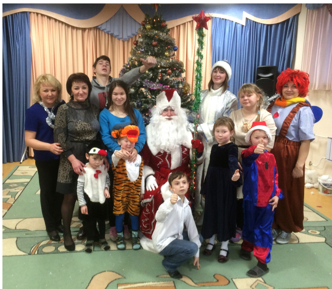
С воспитанниками центра «Апрель»