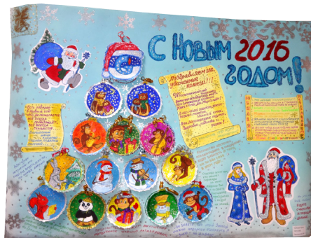
Праздничную стенгазету Производства №2 подготовил Артём Трубицын