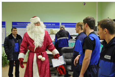
Дед Мороз пожаловал в операторную КОМТ