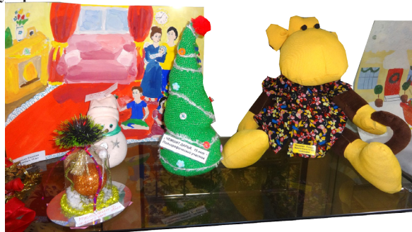
Елочки и обезьянки – популярные персонажи выставки

Все 97 участников конкурса получили сладкие подарки от Деда Мороза.