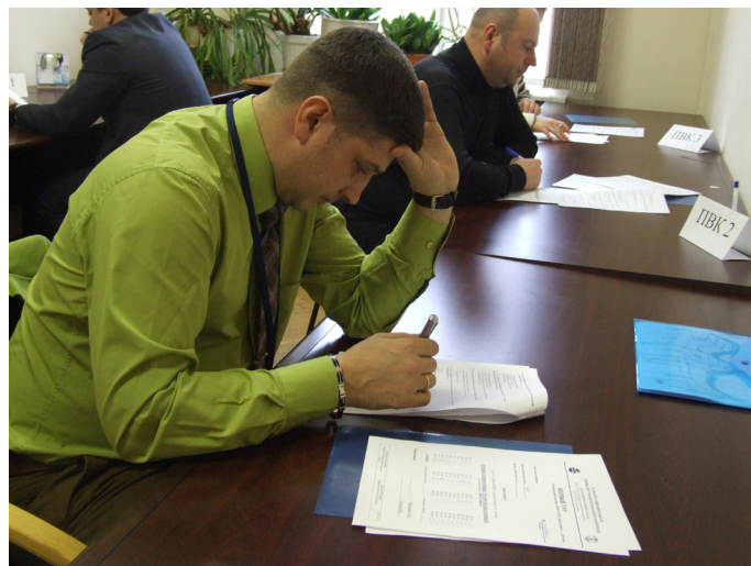
Составление инструкции – дело не простое.

«Неразрушающий контроль – важная часть работы, направленной на диагностику и своевременное выявление дефектов сварных соединений технологического оборудования, эксплуатируемого на Сургутском ЗСК. Это более 800 сосудов, работающих под