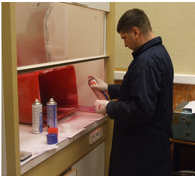
Выполнение конкурсного задания.